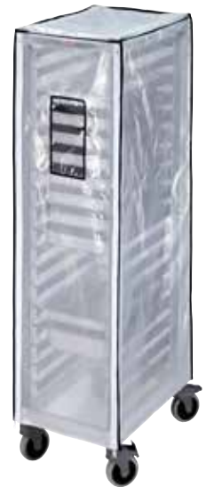
GBCTUGNPR11 Housse de protection en option pour les échelles hautes GN 1/1.

Toutes les échelles sont livrées en kit complet dans un carton avec les roues et les cadres inférieurs et supérieurs assemblés en usine.