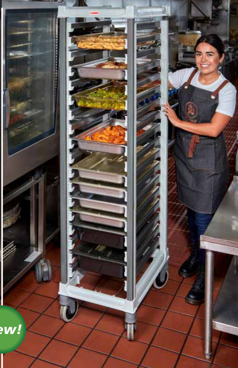
Échelle haute GN 2/1 UGNPR21F36