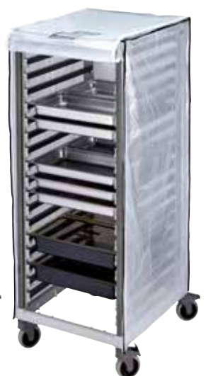
GBCTUGNPR21 Housse de protection en option pour les échelles hautes GN 2/1.