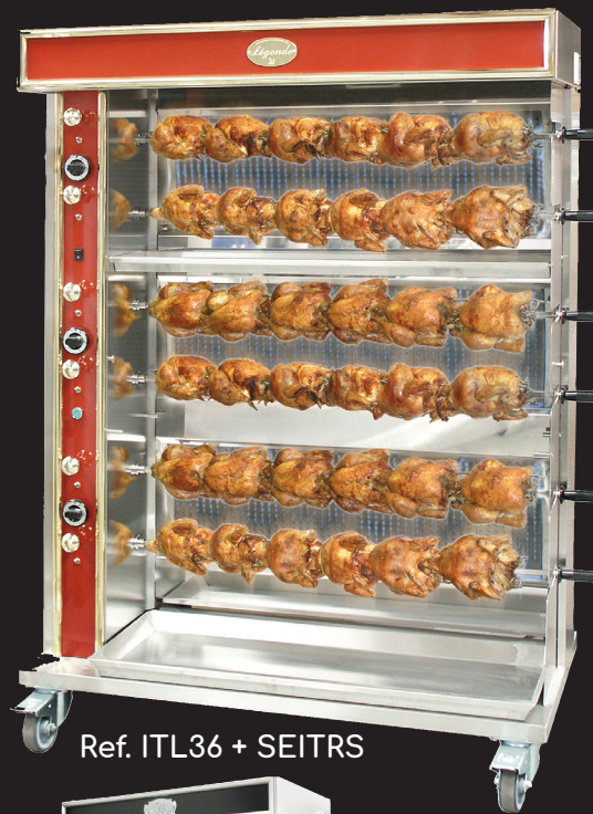
Ref. ITL36 + SEITRS