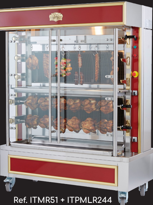
Ref. ITMR51 + ITPMLR244