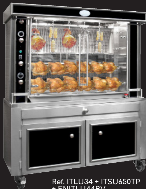
Ref. ITLU34 + ITSU650TP + ENITLU44BV