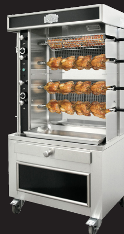
Ref. ITL34 + ITSE650T