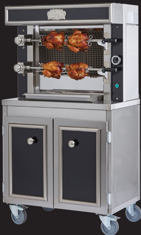
Ref. ITNR2 + ITPNR390