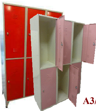
A3/6 ou B3/6