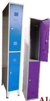
A1/2 ou B1/2