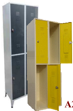
A2/4 ou B2/4