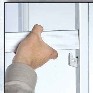
Montage sans outils