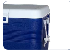
Poignées de portage