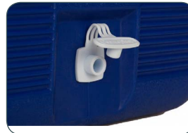
Bouchon de vidange intérieur / extérieur