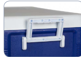
Poignées de portage