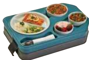
ITPD3753T - Euronorme = Ref 37530