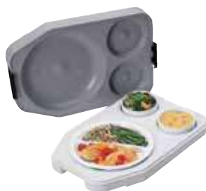
ITPD3253 - Gastronorme

*Avec plaque eutectique chaude. Cet article n'est pas recommandé pour les chariots chauffants.