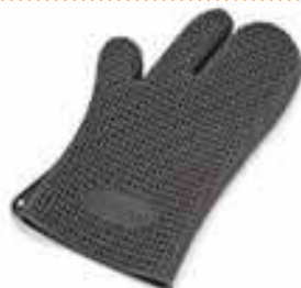
GANT DE PROTECTION ANTI-CHALEUR

INFO Étanche. Lavable en machine. Antidérapant. Non poreux et très résistant. Conforme aux normes alimentaires. Trou de suspension.