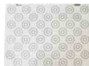
TAPIS DE CUISSON SPÉCIAL MACARONS

INFO Anti-adhérent en silicone. Possèdent des repères Ø 35 mm. Le petit rond Ø 15 mm permet de bien positionner la douille au centre. Pratique lors de fabrication en série pour optimiser la surface et être régulier.