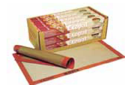
TOILE DE CUISSON EXOPAT