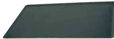
PLAQUE PÂTISSIÈRE - Alu anti-adhésif