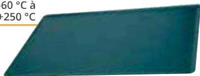
PLAQUE PÂTISSIÈRE - Tôle noire