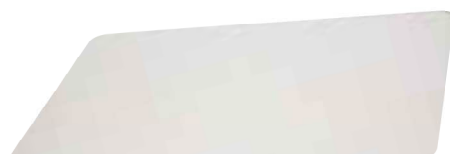
PLAQUE PÂTISSIÈRE - Inox